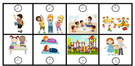
Моят ден в детската градина:

ЗАЩО? Визуализацията дава ясна представа и на родителите, но преди всичко на децата. Прави промените по-разбираеми и очаквани, сваля напрежението от неизвестността и носи сигурност! Това дава възможност на семейството да опита да въведе този режим вкъщи, за да доближи максимално рутините у дома до тези с групата. Важна тук е визуализацията.